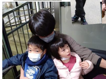
山地獄で 動物とふれ あいました