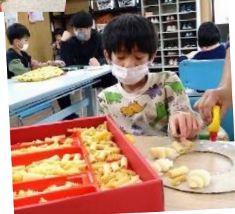
前面飾りのクリスマスリースを作っています