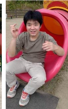
吉四六ランドで遊んでいます アイスを買いました