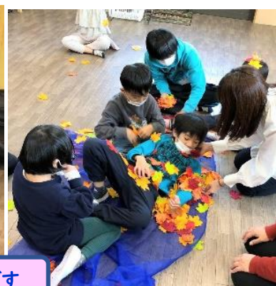
リトミック教室は、とっても楽しいです