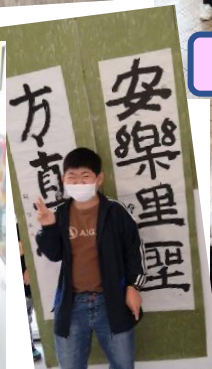
ときめき作品展に行き、じっくり鑑賞しました